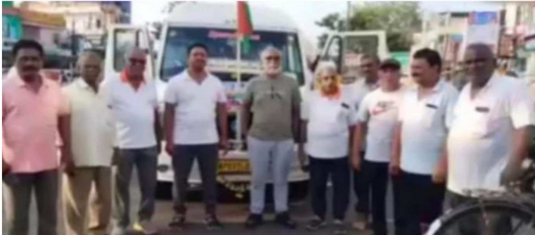
దారిపొడవునా గ్రామాల్లో, పట్టణాల్లో విద్యార్థులకు, డ్రగ్స్ వద్దు బో అంటూ నినదించారు.క్షణికానందం యువతకు డ్రగ్స్ వల్ల కలిగే అనర్థాలను వివరిస్తూ, డ్రగ్స్ కోసం జీవితాలను బలివీరం ఎక్కించవద్దని, డ్రగ్స్ సాగుతోంది. పొన్నూరులో జరిగిన ఈ కార్యక్రమంలో రహిత ఆంధ్రప్రదేశ్ ను నిర్మించడమే ఈ యాత్ర స్థానిక అధికారులు, యువత పెద్ద సంఖ్యలో పాల్గొని అంతిమ లక్ష్యమని నిర్వాహకులు తెలిపారు.